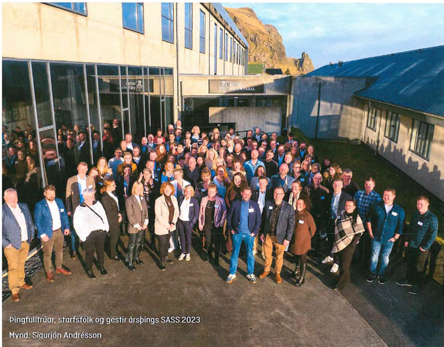
Þingfulltrúar, starfsfólk og gestir árþings SASS 2023

Hér á eftir má sjá samantekt yfir forgangsröðun og allar ályktanirnar koma þar á eftir.